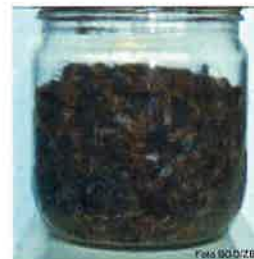
Abb. 100 Gramm Bienen

Mindestens 100 Gramm (ca. 1'000 frisch gestorbene oder sterbende Bienen ) sammeln und diese in eine saubere und luftdurchlässige Verpackung (Karton, Holz) verschliessen. Vermeiden Sie Plastikverpackungen, da diese die Verwesung und den Abbau eventueller Pestizidrückstände beschleunigen. Bitte senden Sie keine toten Bienen, die schon Anzeichen von Verwesung zeigen. Verdächtige Bienen mit Pollenhöschen in eine separate Schachtel legen.