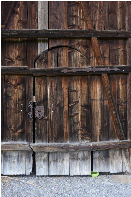
Feldscheune Burstel, Mannstür im Tenntor, Ansicht von SO, 04.11.2022 (Bild Nr. D100692_91).