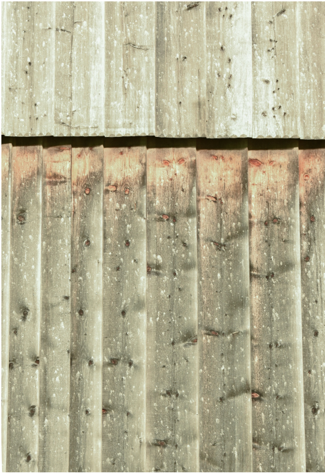
Feldscheune Burstel, gegen SO überlappende, wettergerechte und verzierte Holzverkleidung an der Südwestfassade, 04.11.2022 (Bild Nr. D100692_94).