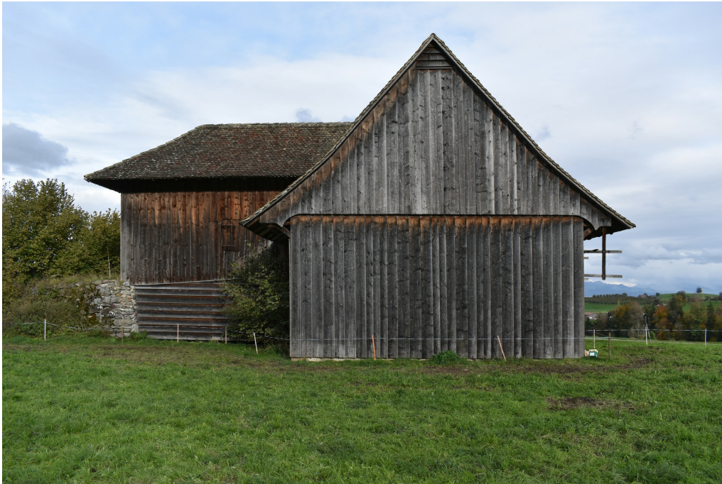
Feldscheune Burstel, Ansicht von SW, links die Hocheinfahrt, davor die Rampe, 04.11.2022 (Bild Nr. D100692_93).