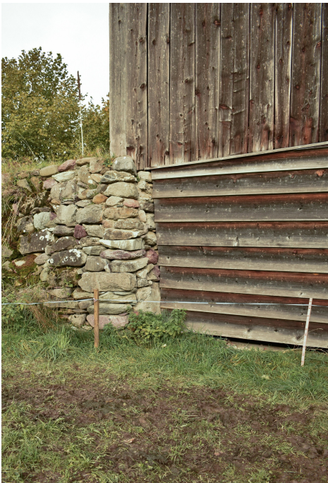
Feldscheune Burstel, Rampe auf trocken geschichteten Natursteinen, Übergang zur Hocheinfahrt, Ansicht von SW, 04.11.2022 (Bild Nr. D100692_95).