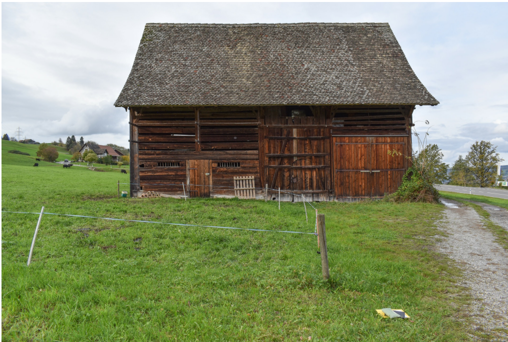
Feldscheune Burstel, Ansicht von SO, links der Stallbereich, darüber ein Heuboden, 04.11.2022 (Bild Nr. D100692_90).