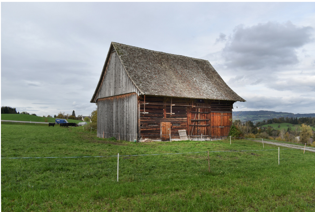
Feldscheune Burstel, Ansicht von S, 04.11.2022 (Bild Nr. D100692_96).