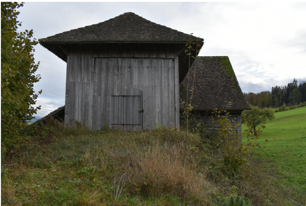
Feldscheune Burstel, Ansicht von NW, die Hocheinfahrt, 04.11.2022 (Bild Nr. D100692_99).