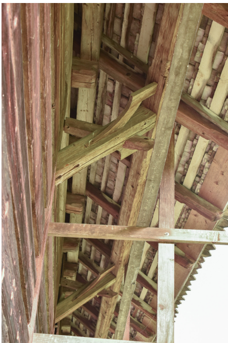
Feldscheune Burstel, Vordachstützen an der Südostfassade, 04.11.2022 (Bild Nr. D100692_92).